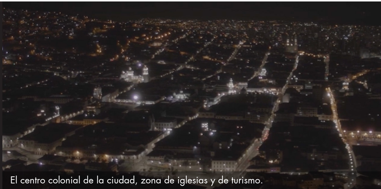
El centro colonial de la ciudad, zona de iglesias y de turismo.

La ciudad de Quito es el escenario de AMAZONA , como en estas escenas rodadas para el teaser: