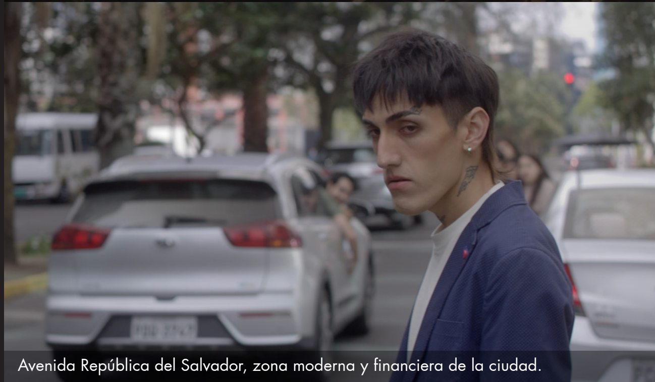
Avenida República del Salvador, zona moderna y financiera de la ciudad.